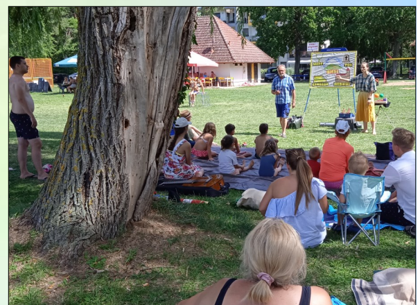
Alle Programme werden ins Ungarische übersetzt

Wenn du ein handliches Musikinstrument spielst, bring es unbedingt mit. Auch für deine eigenen erprobten Ideen sind wir aufgeschlossen. An den Vormittagen werden wir uns neben der geistlichen Zurüstung Zeit nehmen, Methoden einzuüben und auszuprobieren. Das ist eine hervorragende Gelegenheit, ungeahnte Begabungen zu entdecken.