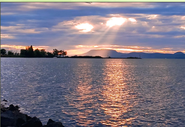
Der Badacsony, von Balatonszemes aus gesehen

Charakteristisch für das Nordufer sind die Ausläufer des Bakony-Gebirges mit ihren erloschenen Vulkankegeln. Besonders markant ist der weithin sichtbare Tafelberg Badacsony mit seinem Weinanbaugebiet.