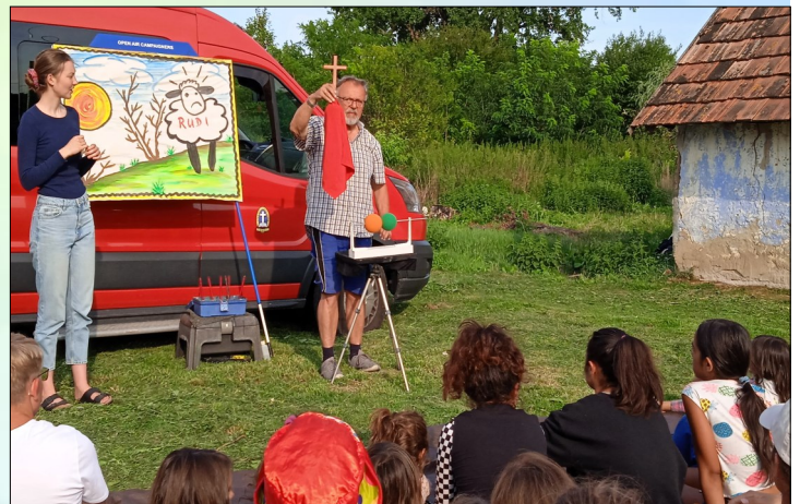
Einsatz des Balaton-Teams in einer Roma-Siedlung

...ist ein internationales Missionswerk mit Zweigen in über 30 Ländern. OAC wurde 1892 in Australien gegründet und arbeitet auf Basis der evangelischen Allianz mit Kirchen und Freikirchen zusammen. Das Ziel dieser Arbeit ist es, die Menschen da mit dem Evangelium zu erreichen, wo sie sind. Dazu zählen neben Schulen, Heimen und Strafanstalten auch Fußgängerzonen, Campingplätze, Badestrände, Uferpromenaden und soziale Brennpunkte.