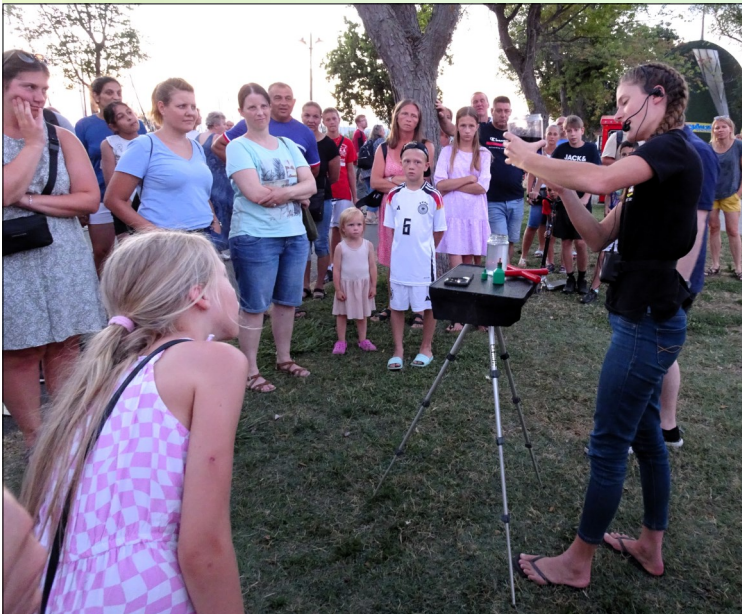
Abendeinsatz mit der Illustration „Chemical Cross“ die zeigt, dass nur das Blut von Jesus Christus von aller Sünde reinigt

OAC-Missionsteams e.V., Frankfurter Straße 177, 57290 Neunkirchen, Tel.: 02735/5980, E-Mail: info@oac-d.de